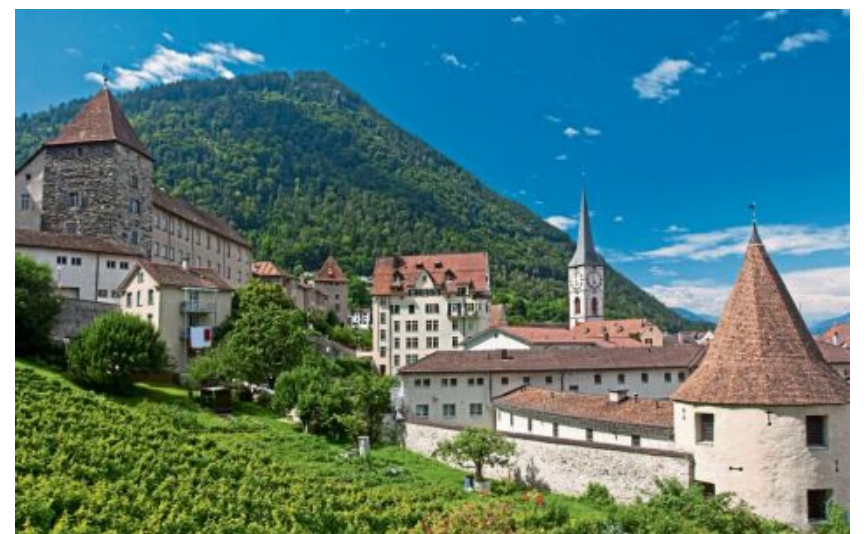
Chur ist die Hauptstadt des ostschweizerischen Kantons Graubünden.

Mittlerweile haben wir die Hälfte der Bahnen absolviert und längst ist klar: Mit dem Golfschläger spielen wir uns in die