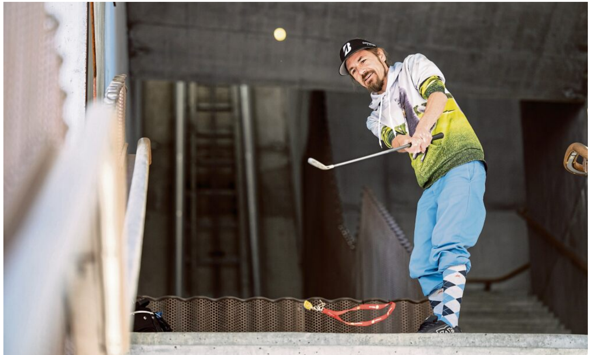
Chur spielerisch entdecken: Beim Citygolfen „schlägt“ man sich durch Gassen und Winkel der Stadt und überwindet dabei selbst Treppenauf- und -abgänge.