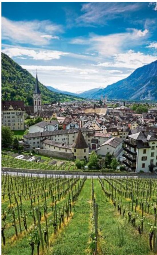
Schöner Blick von einem Weinberg auf das alpenumrahmte Stadtpanorama.